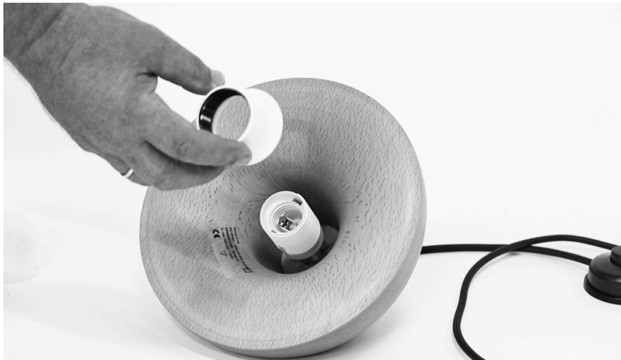
1. Befestigungsring der Fassung abschrauben.