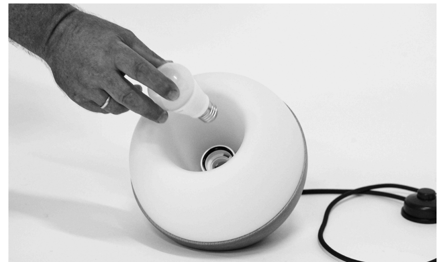
4. Leuchtmittel einschrauben.