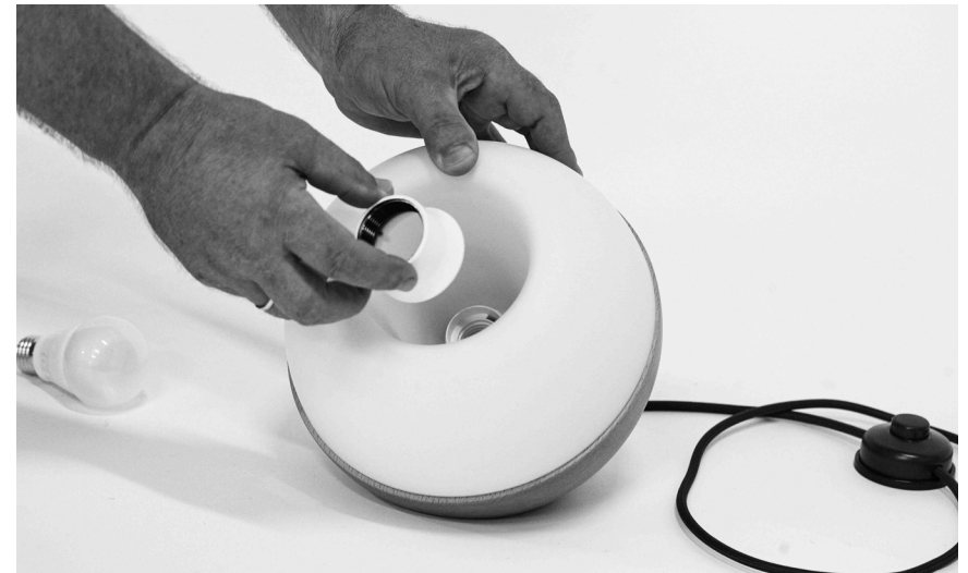
3. Befestigungsring auf die Fassung schrauben und mit Gefühl – nicht zu fest! – anziehen.