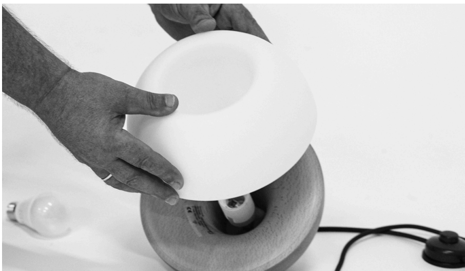
2. Glasschirm auf die Holzbasis setzen.